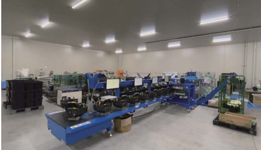
年間を通して 15℃、集塵装置も完備した、人にも花にもやさしい花加工場

コールドチェーンと低温貯蔵 + 加工場で生花の花持ちを最大限に発揮させる最新花加工センター